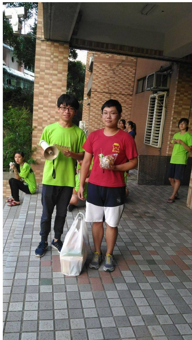
宿舍闖關活動頒獎