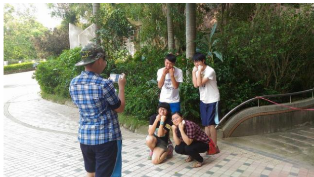
還原現場：到指定地點拍攝指定動作